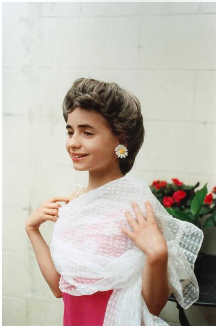
The overambitious First Lady (1996). Zbyt ambitna Pierwsza Dama (1996 r.).