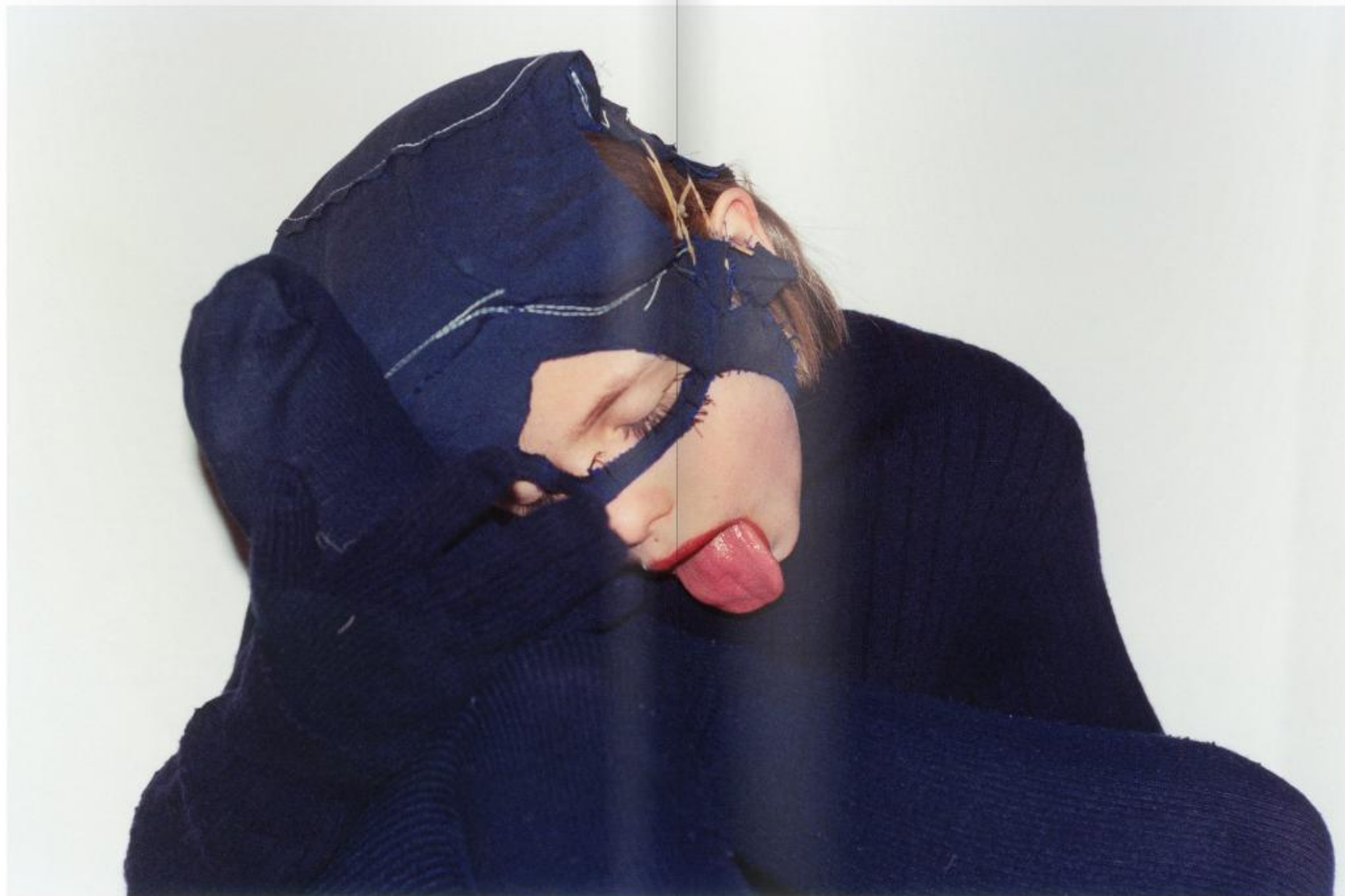
Catwoman uncensored (1994). Kobieta Kot bez cenzury (1994 r.).