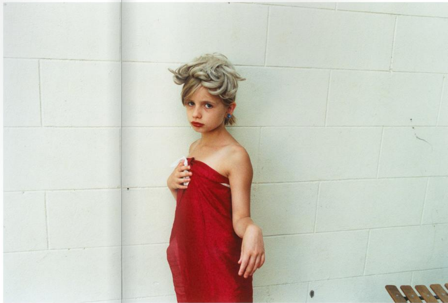
The mist (1996). Odmisnec (1996 r.).