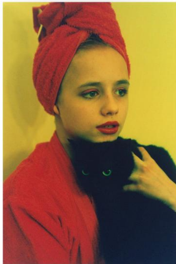
(left) I'm an old woman now (1996). | (above) What's new, pussycat? (1968). (po lewej) Jestem już starą kobietą (1996 r.). | (powyżej) Co słychać, koteczko? (1968 r.).