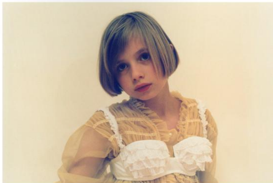
Real wldk chdk (1994). Prawdziwie dzkie dziecko (1994 r.).