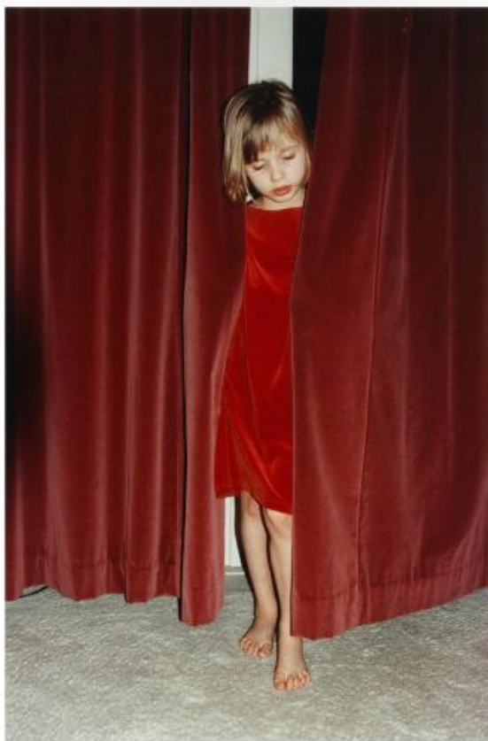
(above) Nothing is what it seems (1993). | (right) Looking at Ruud (1994).

(powyżej) Nic nie jest tym, czym się wydaje (1993 r.). | (po prawej) Patrząc na Ruud (1994 r.).