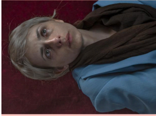
Melnyman, Aw'd/ Things © Melnyman